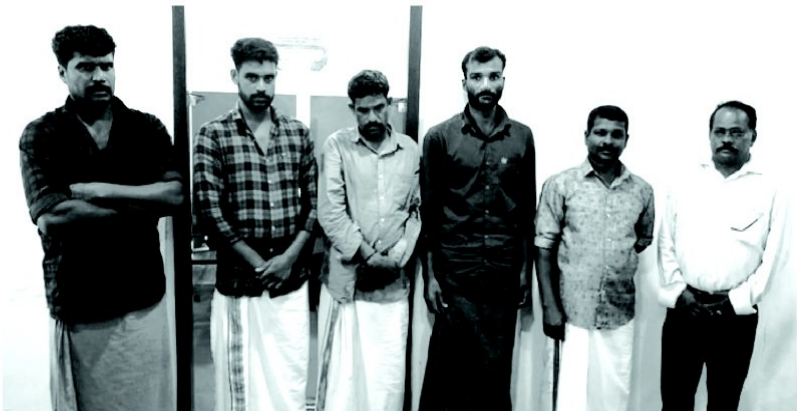
ചതുരംഗപ്പാറ പാറമട സ്പോട്കവസ്തു മോഷണ കേസിൽ അറസ്റ്റിലായവർ